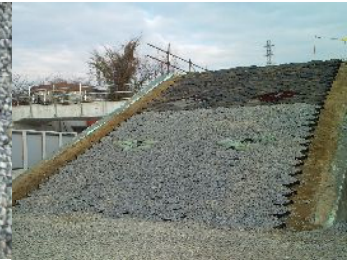
写真1 ジオセル敷設