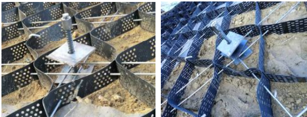
写真5 標準的な頭部処理工の例

頭部処理工の代表的な例を写真5に示す。頭部処理工は、アンカー頭部に複数枚の押圧板をナット等で締結する構造となっており、地山部ならびに充填材を確実に押圧することが可能となり、高剛性なプレートを構築することができる。また、この押圧効果により縦・横方向に挿入された連結用鉄筋を通じ周辺セルにもおおよび高い補強・拘束効果が得られる。今回の試験施工では、押圧板は1つのセル内に収まる形状を用いたが、求められる性能に応じて複数のセルに跨る構造を容易に構築できる。